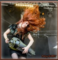
Chansons / compositions (Michel Arramond)

Instrument fascinant par son aspect de "machine à musique" et sa polyphonie, la vieille à roue reste immédiatement identifiable, malgré les multiples variations de sa forme.