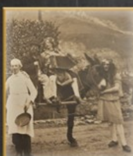
CARNIVAL (LOU RIDEZ 1920)

Facilement transportable et complet, l'instrument s'intègre dans les musiques de danses populaires (polka, mazurka, java, valse, tango...).