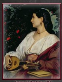
Instrument à cordes (L'Empire)

Après l'engouement de la fin du XVIII e siècle la pratique de la mandoline décline jusqu'à une quasi-disparition en dehors de l'Italie au milieu du XIX e siècle.