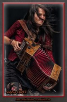
Accordéon diatonique (Sopranos)

Comment lui résister ? Son prix sans doute abordable, son apprentissage plutôt facile, sa nouvelle sonorité, le fait qu'il soit un petit orchestre à lui tout seul, son aisance de transport et sa solidité en en fait un instrument de tous les voyages, de toutes les vagues d'immigration successives du 19 e et début du 20 e siècle.