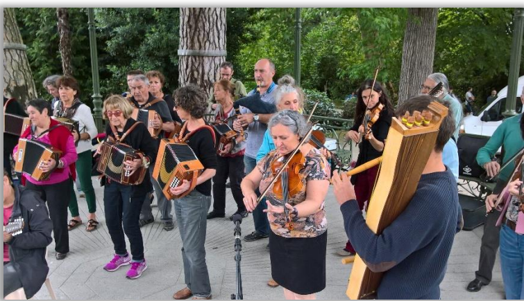
c'était avant, en 2017

*ces morceaux sont soumis à droits d'auteur. C'est la Ville qui règle la Sacem.