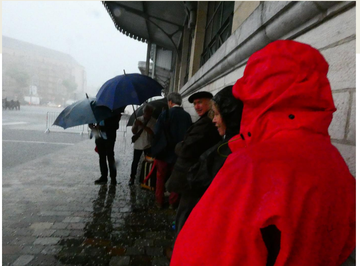
L'orage du 21 juin : eau et glaçons : un vrai pastis !

Nous assurons le changement de plateau. (nous jouons entre les groupes qui passent sur la scène pour éviter les temps morts).