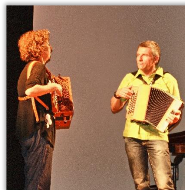
Et des duos célèbres !